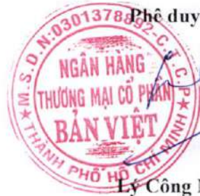
Lý Công Nha