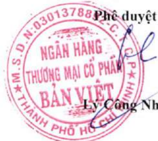
Ly Công Nha