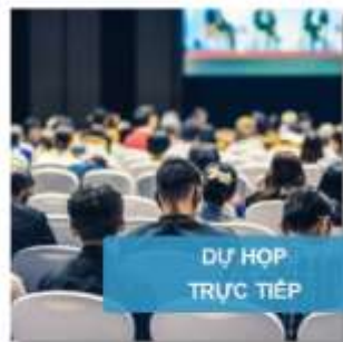
DỰ HỌP TRỰC TIẾP