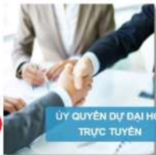
ỦY QUYỀN DỰ ĐẠI HỘI TRỰC TUYẾN