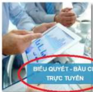
BIỂU QUYẾT - BẦU CỬ TRỰC TUYẾN