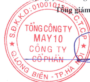
Thân Đức Việt