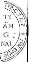
Hồ Sĩ Tuấn